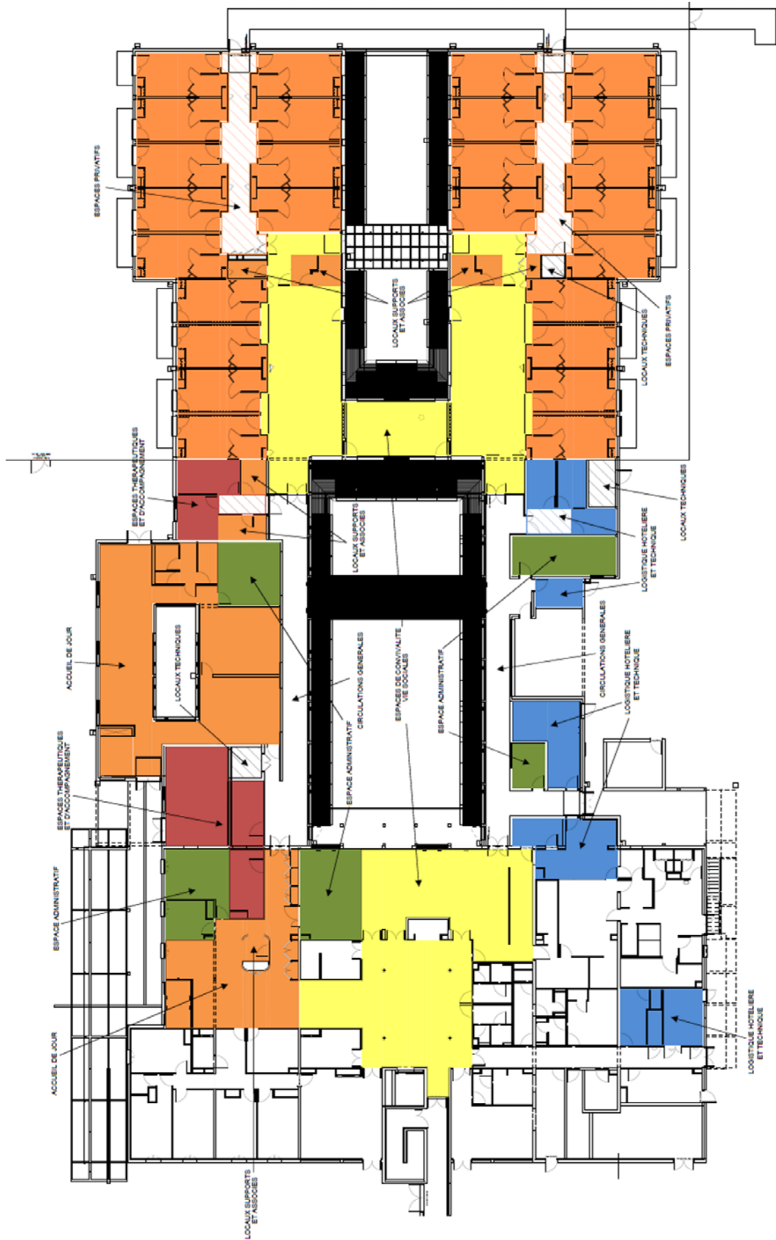
EHPAD LA MEMOIRE DES AILES PLAN RDC