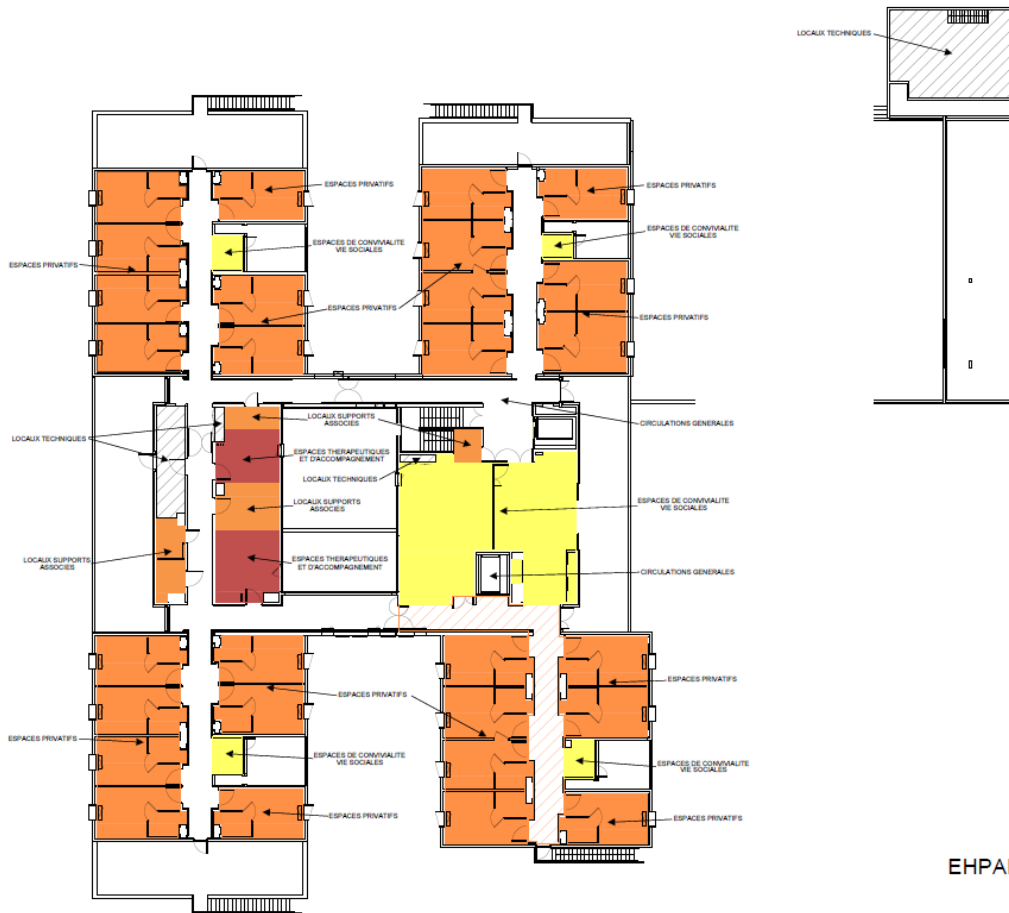
EHPAD LES PINS R+1