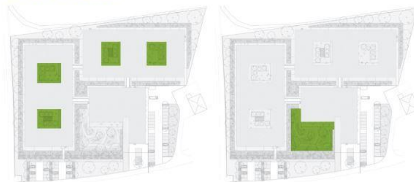
Jardin thérapeutique : Jardin collectif pour résidents à l'échelle d'une unité