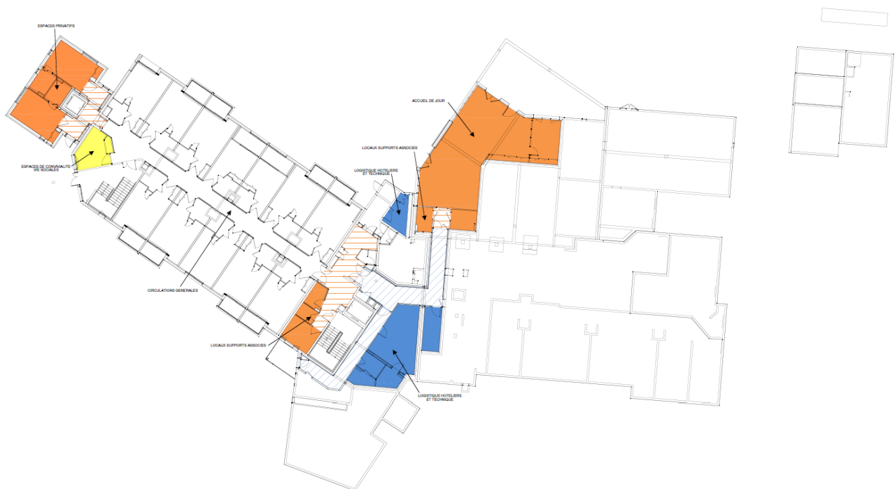
EHPAD LES ERABLES RDJ